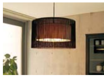
シーリングライト型 ・電球の平均寿命(1日5~6時間点灯の場合)