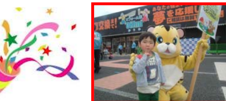
みんな大好きトラさん