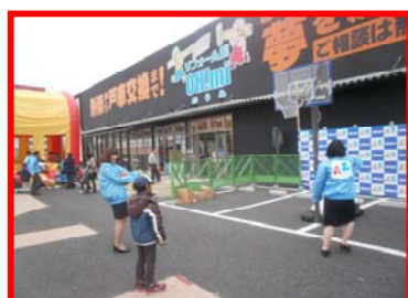
バスケットボール入れ