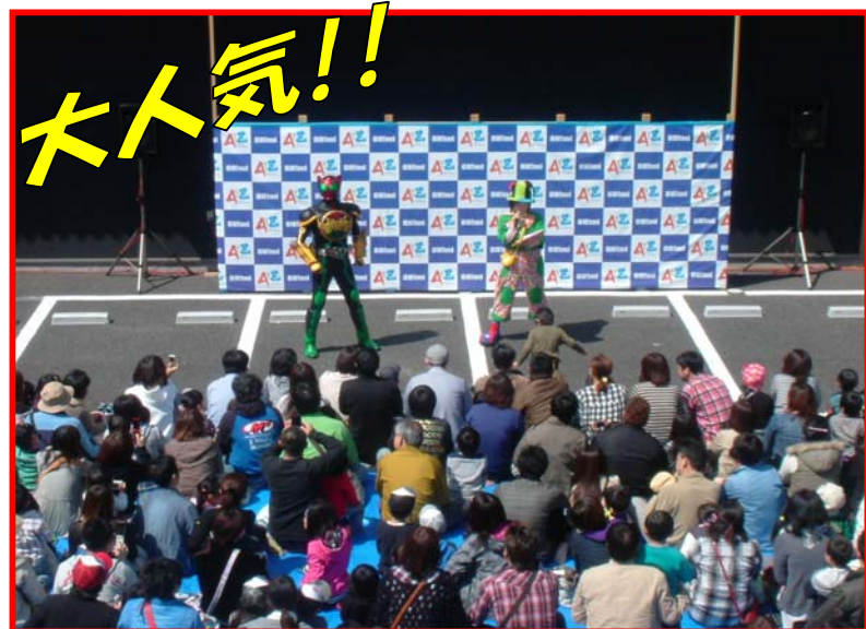
仮面ライダーオース