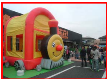
ハッピートレイン