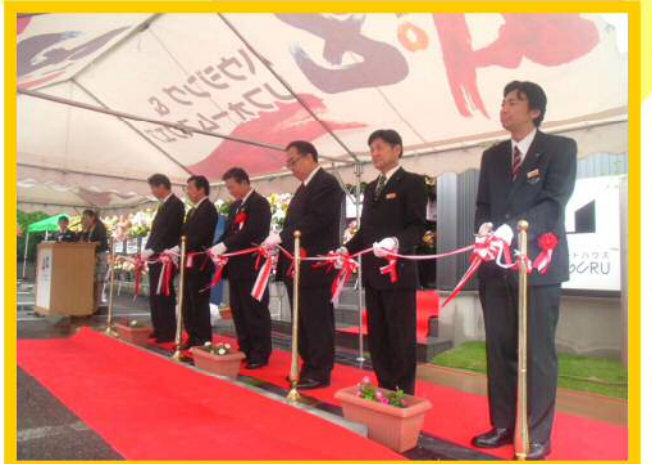
オープン記念式典『テープカット』