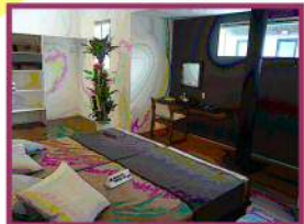
冬暖かく、 夏涼しい家。