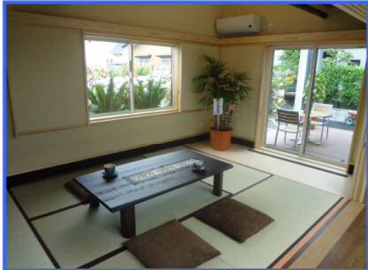
こだわりの和室/天井