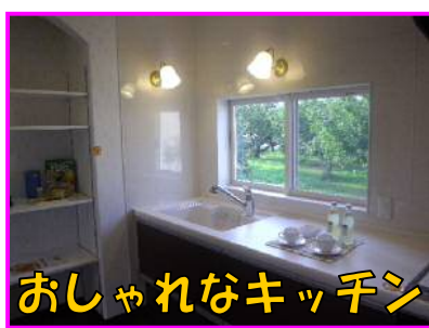
おしゃれなキッチン