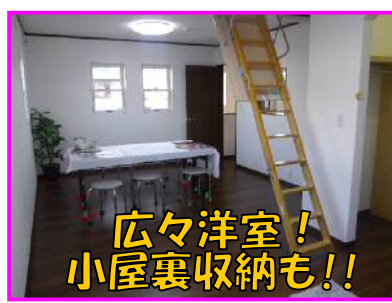
広々洋室! 小屋裏収納も!!