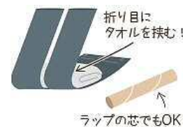
折り目にタオルを挟む! ラップの芯でもOK