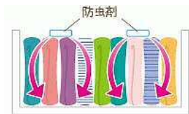
防虫剤の効きめは上から下に

衣装ケースに入れる洋服は、四角くたんで縦に並べましょう。上に積むよりシワになりにくく、取り出しやすいのがメリットです。衣類は生地や色の濃さで分類して収納すると分かりやすいです。防虫剤は、成分が上から下に広がっていきます。衣類の上に載せるのが基本。ジャケットやコート、スーツなども、衣類をたたむ折り目に、クッション材代わりのタオルやラップの芯を挟むと、たたんで収納しても次のシーズンすぐに着られます。その場合は、立てずに寝かせて上に重ねてください。ただし、上が重すぎるとシワになるので、重ねるのは4着くらいまでにしましょう。