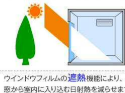
ウィンドウフィルムの遮熱機能により、窓から室内に入り込む日射熱を減らせます。

建物や窓の構造的にすだれなどが付けられない場合は、窓ガラスに断熱フィルムを貼る、という方法もあります。