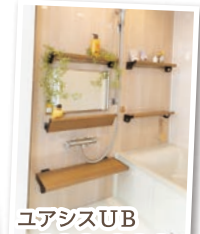
ユアアシスUB ¥400,000 (税抜)