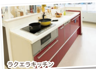
ラクエラキッチン ¥300,000 (税抜)