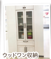
ウッドワン収納 ¥100,000 (税抜)