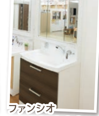
ファンシオ ¥100,000 (税抜)