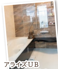
アライズUB ¥450,000 (税抜)

キッチン、トイレ、お風呂、洗面台などリフォーム館天童店ショールーム内に展示されている商品を特別価格にてお譲りいたします! ※本体価格のみの金額です。工事費は別途必要となります。