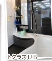
トクラスUB ¥530,000 (税抜)