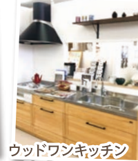
ウッドワンキッチン ¥450,000 (税抜)