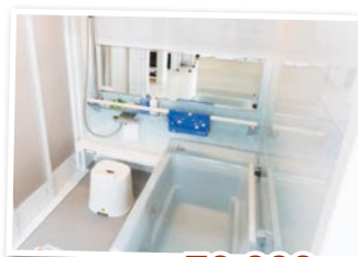
アクリアUB ¥70,000 (税抜)